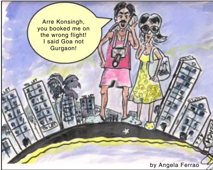
by Angela Ferrao

Those interested in viewing this programme can send a mail on aamigoenkar@yahoo.com . The price of the DVD is Rs. 199/-