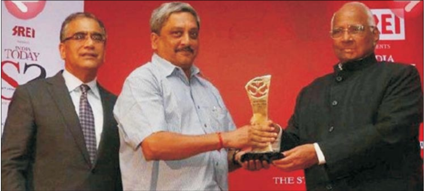
Hon. CM of Goa, Shri. Manohar Parrikar received India Today- Good Governance award