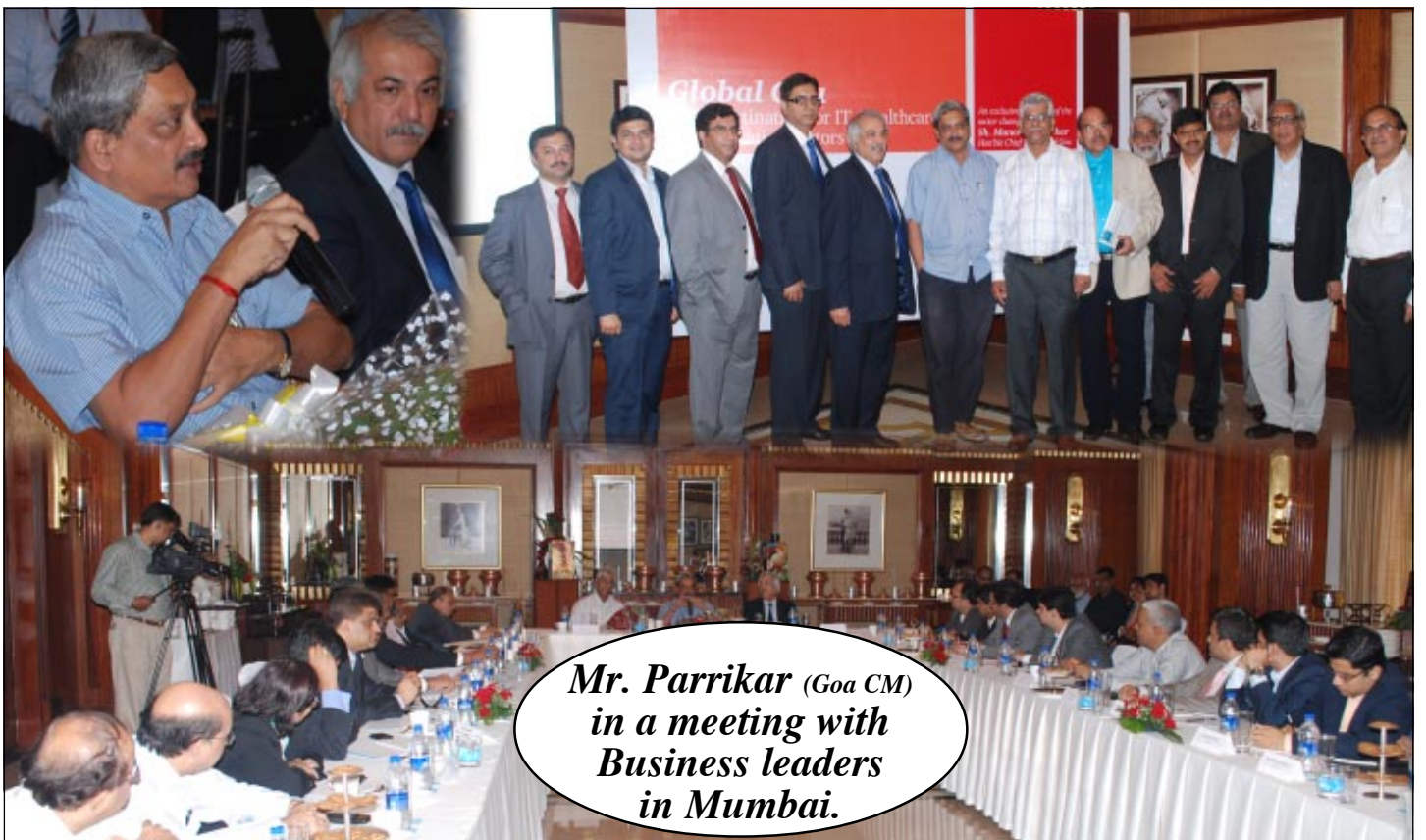
Mr. Parrikar (Goa CM) in a meeting with Business leaders in Mumbai.